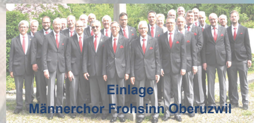
Einlage Männerchor Frohsinn Oberuzwil

18:30 UHR SAALÖFFNUNG VERPFLEGUNGSMÖGLICHKEIT BIS 19:30 SOWIE IN DER PAUSE UND NACH DEM KONZERT