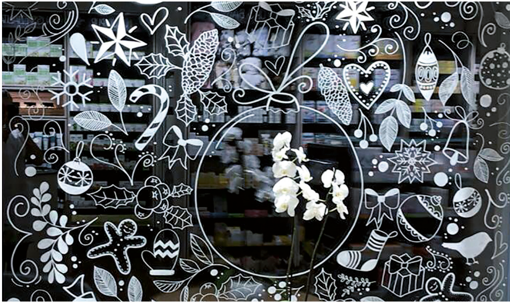
Galerie am Gleis

Bist du bereit, deine kreative Ader zum Leben zu erwecken? Dann ist unser Kurs Chalklettering und Windowlettering genau das Richtige für dich!