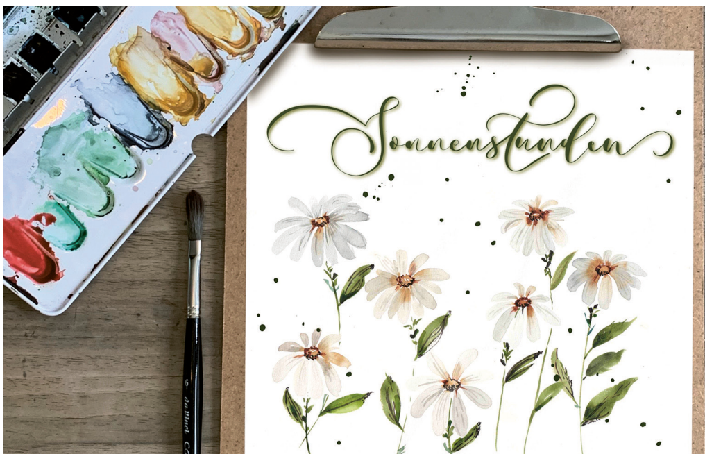
Galerie am Gleis

Komm, tauch ein in die Welt der Aquarellmalerei und reserviere dir einen Platz.