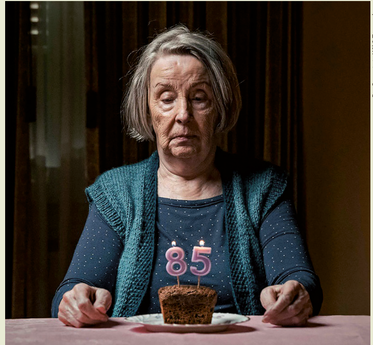
Pro Senectute Wil & Toggenburg

Ende September verschickt Pro Senectute Wil & Toggenburg wieder ihren jährlichen Sammelaufwurf in alle Haushaltungen der Region. Pro Senectute bedankt sich für die Solidarität und Unterstützung! | Pro Senectute Wil & Toggenburg