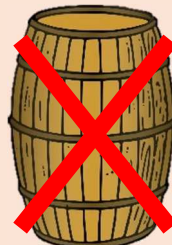
Oben verjüngte Fässer