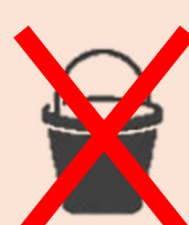
Plastikbehälter und Kübel