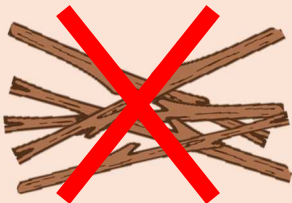
Ungeordnet herumliegendes Strauchwerk und Äste