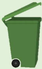
Rollcontainer mit Griff ab 120 Liter